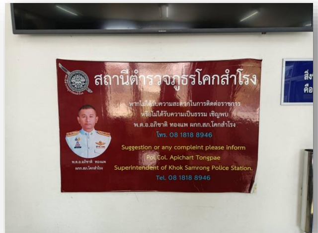
(ป้ายประกาศหากไม่ได้รับเป็นธรรม)